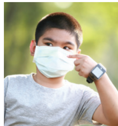
Les résidents qui désirent recycler leurs couvre-visages jetables peuvent les déposer à la bibliothèque Reginald-J.-P.-Dawson durant les heures normales d'ouverture, dans le contenant prévu à cet effet.