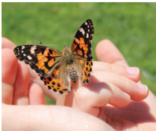
Une équipe d'Espace pour la vie (Biodôme, Insectarium, Jardin botanique, etc.) se déplace tout l'été pour célébrer la nature et poursuivre un travail de vulgarisation à la grandeur de l'agglomération. De passage au parc Dakin le dimanche 27 juin, elle a réalisé 84 interventions éducatives.